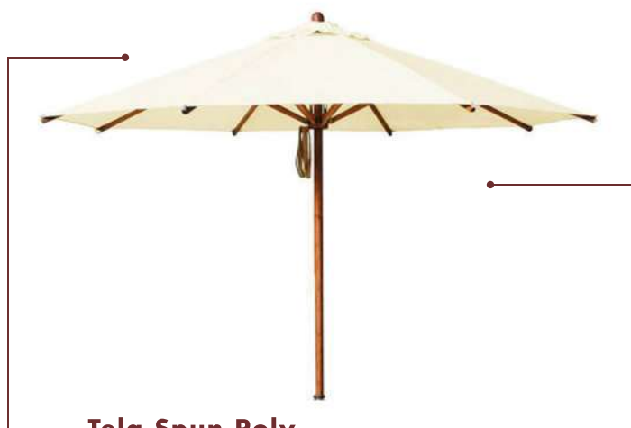
Tela Spun Poly